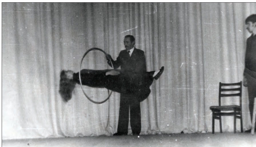
Иллюзионист прекрасно работает с публикой